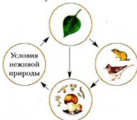
Рис. 2. Структура природного сообщества

энергию. Третье звено — гетеротрофы (животные и грибы), которые потребляют созданные растениями органические вещества и энергию. Четвертое звено — тоже гетеротрофы (это бактерии, грибы, животные), но они разлагают мертвые органические вещества до неорганических веществ (соли, углекислый газ, вода), возвращают их снова в окружающую среду, где они вновь могут поглощаться зелеными растениями (рис. 2).